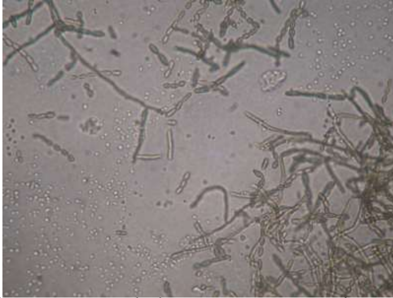
Hình 3: Nấm Cladosporium có sắc tố màu vàng nâu xen lẫn với nấm C. albicans được nuôi cấy từ bệnh phẩm

Một tuần sau khúm nấm sợi có sắc tố đen mọc ở cả 2 nhiệt độ nhưng vẫn tốt hơn ở 37 0 C Kết quả định danh nấm sợi: Cladosporium bantiana . Chẩn đoán xác định: thương tổn apxe não do nhiễm phối hợp nấm men Candida albicans và nấm sợi có màu Cladosporium bantiana . (hình 3,4).