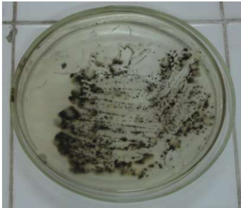
Hình 5: Nuôi cấy bệnh phẩm, Cladosporium và Candida mọc sau 24 giờ và Cladosporium mọc sau 1 tuần.