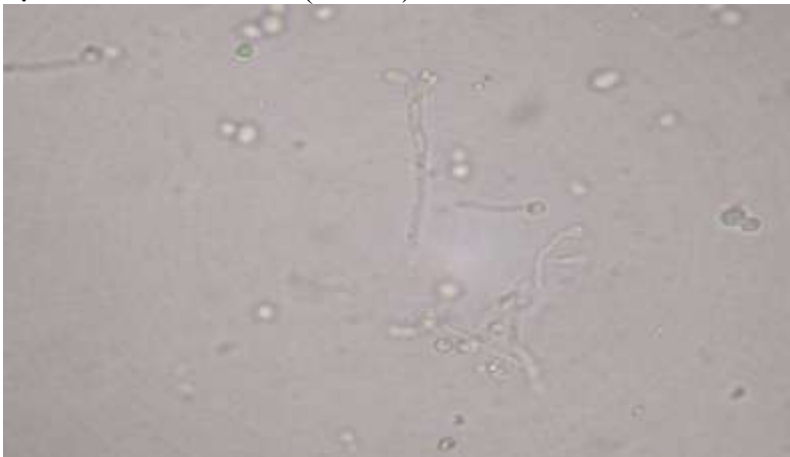
Hình 3. Ống mầm của C. albicans nuôi cấy từ bệnh phẩm

Xét nghiệm với mực tàu không thấy hình ảnh nấm. Quá trình theo dõi định danh nấm như sau: Sau 48 giờ mẫu nuôi cấy mọc khuẩn lạc nấm men màu trắng sữa ở cả nhiệt độ phòng và 37 0 C nhưng vi nấm mọc tốt hơn ở nhiệt độ 37 0 C, bên cạnh đó bắt đầu xuất hiện những khúm nấm có màu đen mọc ngay tại điểm nuôi cấy bệnh phẩm và cùng vị trí với khúm nấm men. Kết quả định danh nấm men: thử nghiệm sinh ống mầm dương tính với lòng trắng trứng, test urease âm tính, nuôi cấy trên môi trường thạch bột ngô tween 80 xác định Candida albicans ( hình 3).